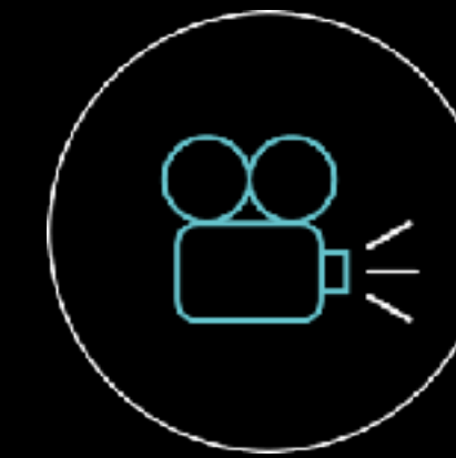
E-Learnings & Produktfilme