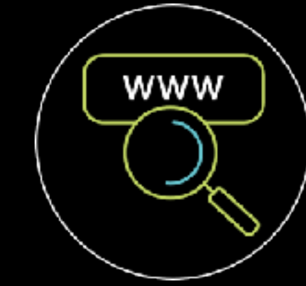
SEO & SEA