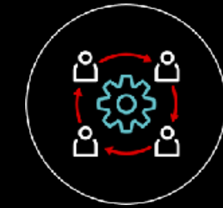
Social Media Marketing